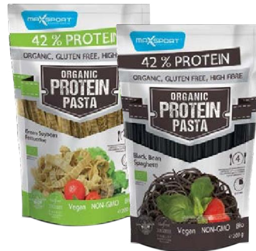
Black bean Spaghetti