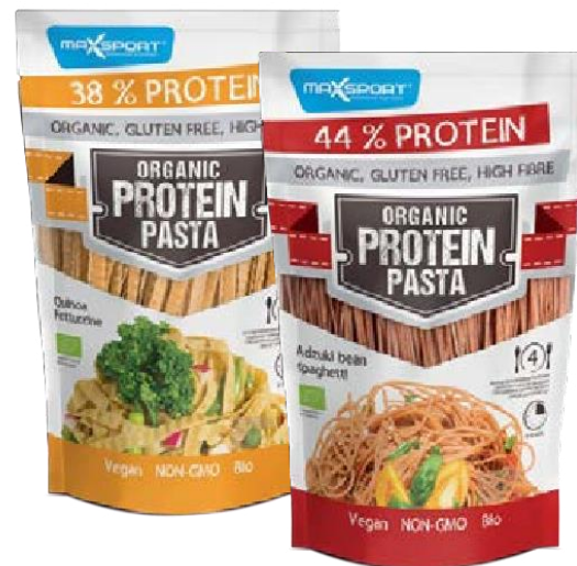
Adzuki bean Spaghetti